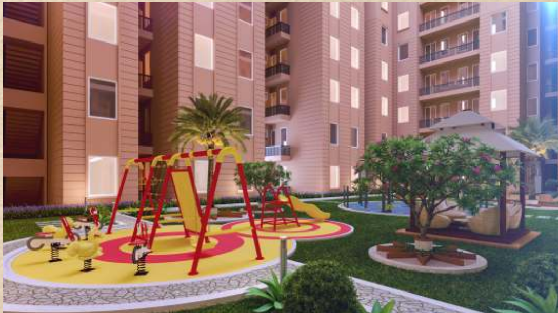
Podium View 02